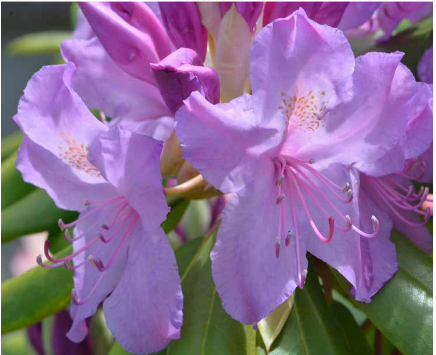
„Rhododendronblüten in Thumen“